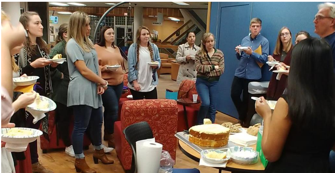
Members and inductees enjoy cake and fellowship during their fourth initiation ceremony on Oct. 30, 2018 when 21 initiates were welcomed to the chapter.